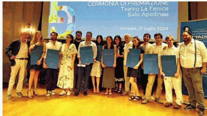
La giuria con i vincitori del Premio Mattador alla Fenice di Venezia