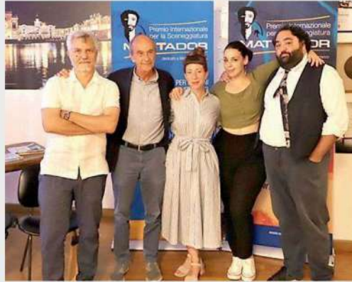
La giuria del Premio internazionale Mattador